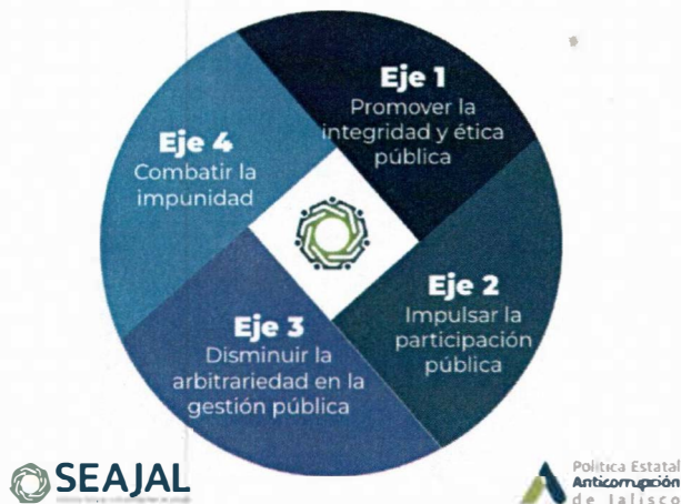
Imagen 1. Ejes rectores en el control de la corrupción

Como se abordará más adelante, las actividades de la Unidad se encuentran congruentemente alineadas a las estrategias, líneas de